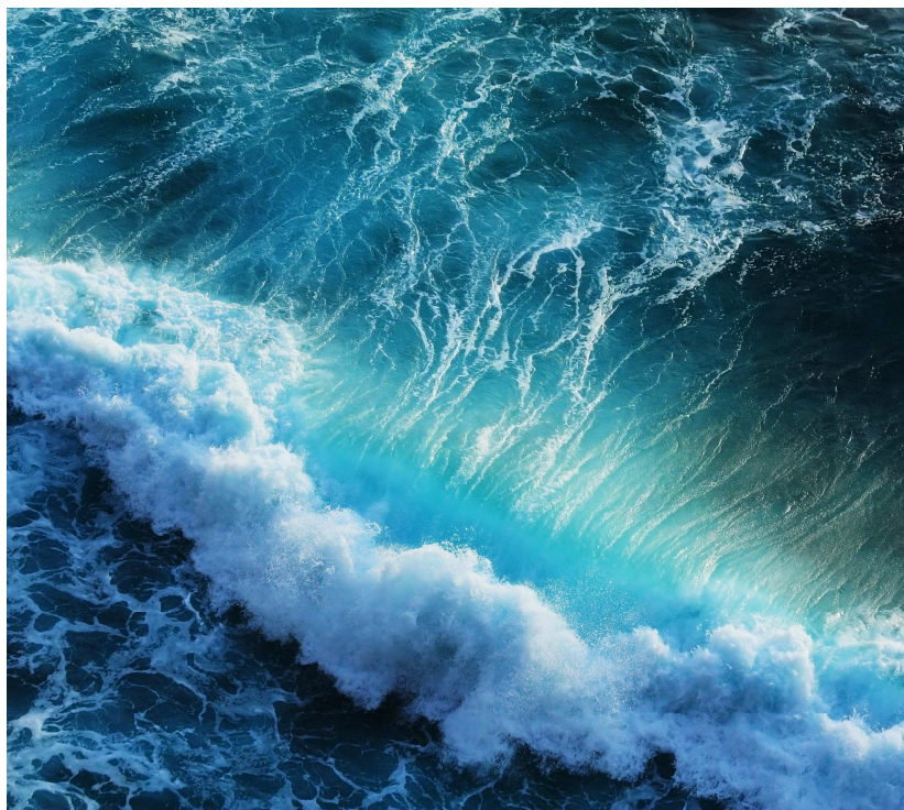
Image de vagues de l'Océan

http://aucoeurdesetoiles.jimdo.com/articles-astrologiques/actu-ciel/